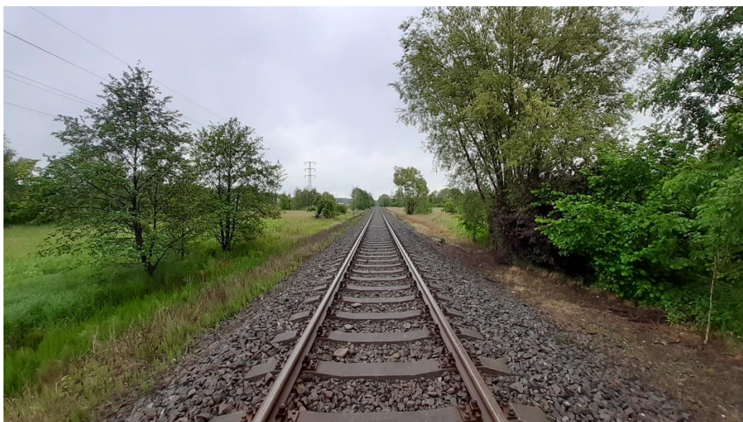
Foto č.1 - Propustek v km 113,306 - Pohled na trať - pohled po směru staničení