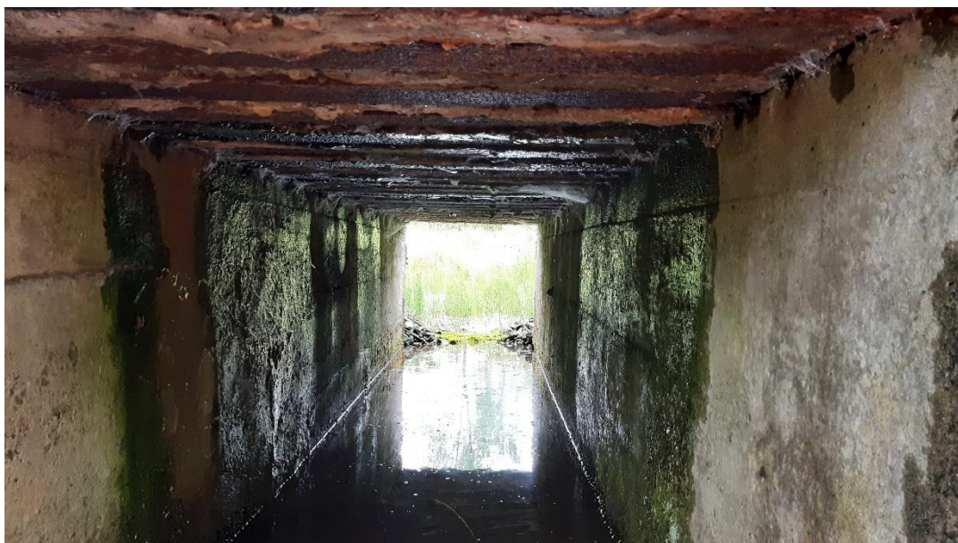
Foto č.5 - Propustek v km 113,306 - Pohled do propustku