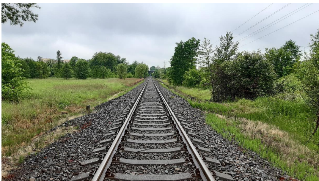
Foto č.8 - Propustek v km 113,546 - Pohled na trať - pohled proti směru staničení