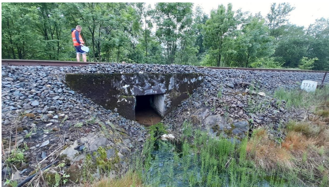
Foto č.3 - Propustek v km 113,306 - Pohled na vtok