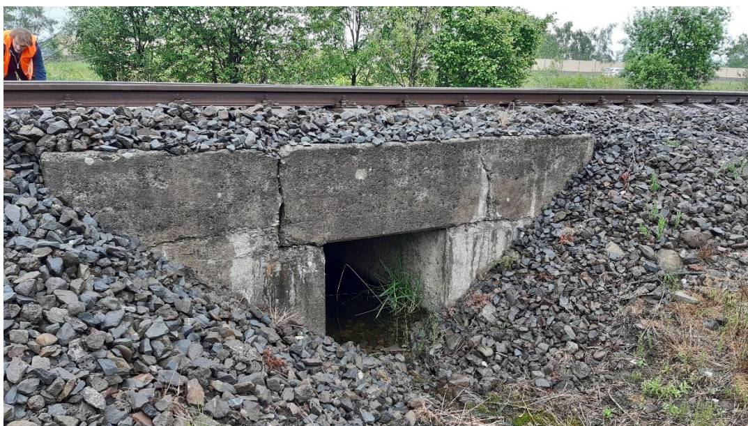
Foto č.10 - Propustek v km 113,546 - Pohled na výtok