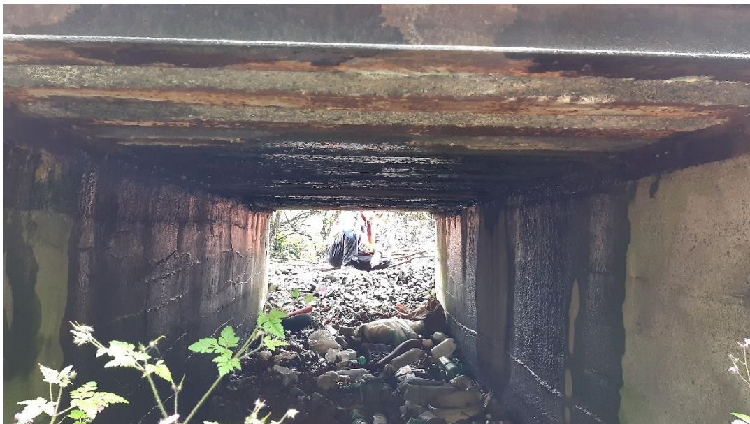
Foto č.17 - Propustek v km 114,185 - Pohled do propustku