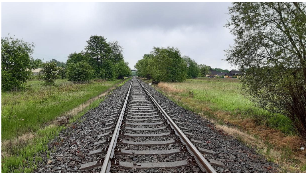
Foto č.7 - Propustek v km 113,546 - Pohled na trať - pohled po směru staničení