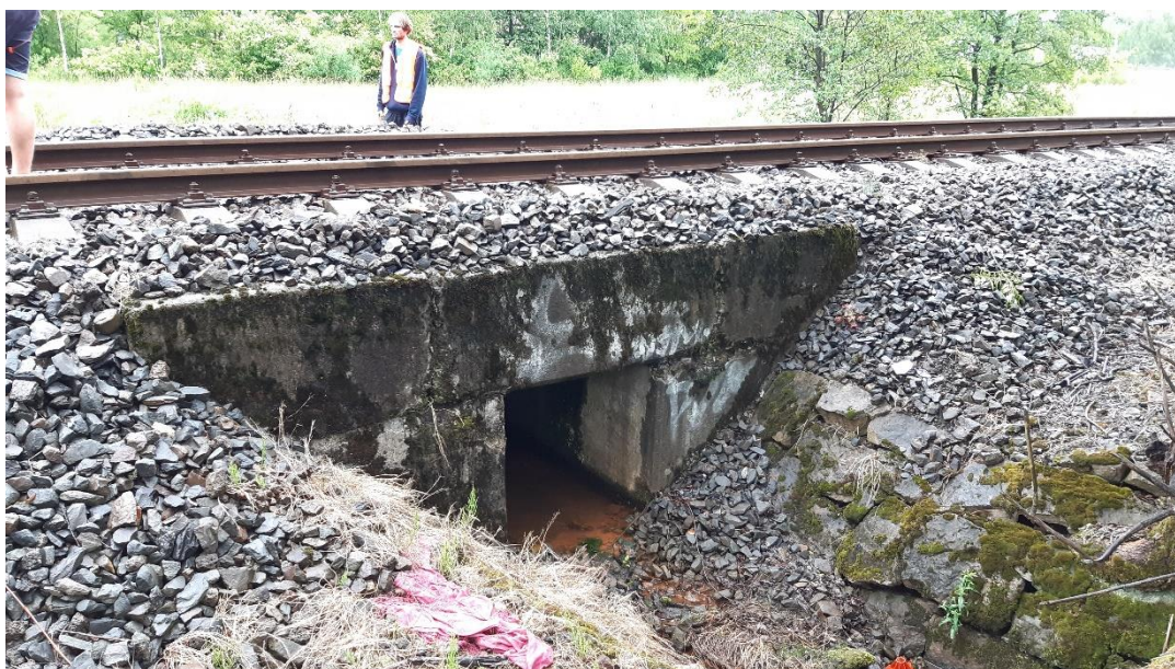
Foto č.4 - Propustek v km 113,306 - Pohled na výtok