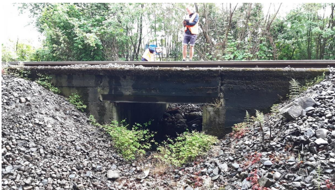
Foto č.15 - Propustek v km 114,185 - Pohled na vtok