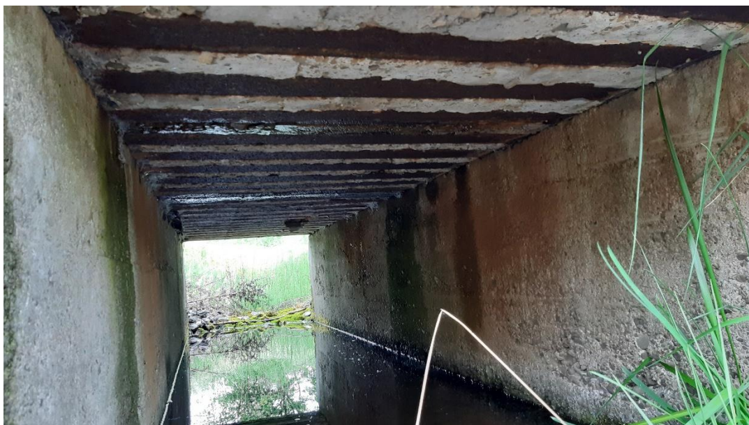
Foto č.11 - Propustek v km 114,185 - Pohled do propustku