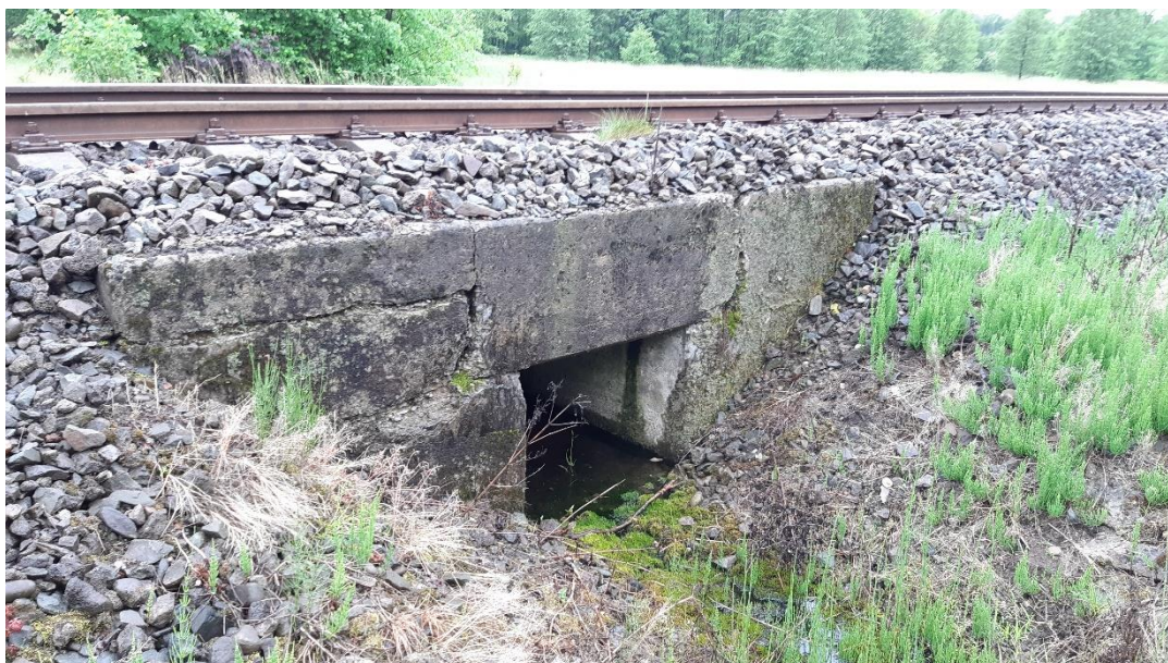
Foto č.9 - Propustek v km 113,546 - Pohled na vtok