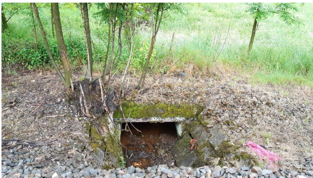
Foto č.6 - Propustek v km 113,306 - Pohled na propustek na výtoku