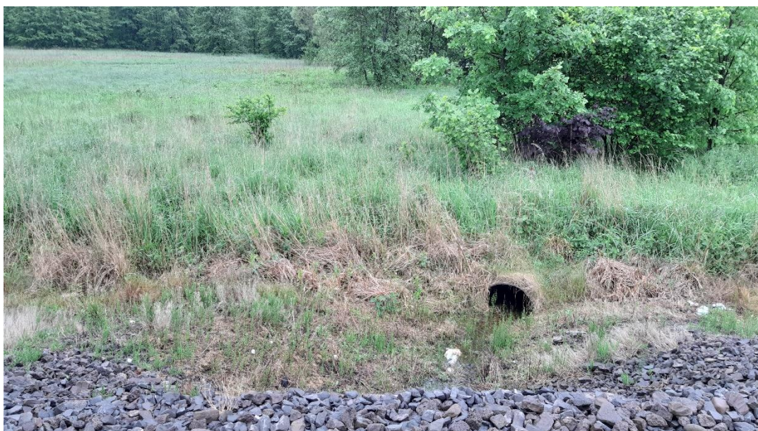
Foto č.12 - Propustek v km 114,185 - Pohled na troubu na výtoku