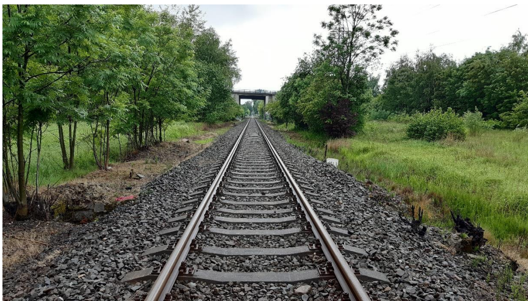
Foto č.2 - Propustek v km 113,306 - Pohled na trať - pohled proti směru staničení