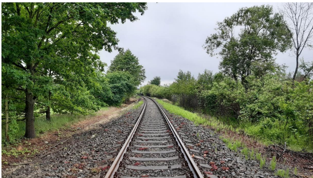
Foto č.14 - Propustek v km 114,185 - Pohled na trať - pohled proti směru staničení