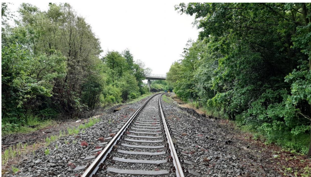
Foto č.13 - Propustek v km 114,185 - Pohled na trať - pohled po směru staničení