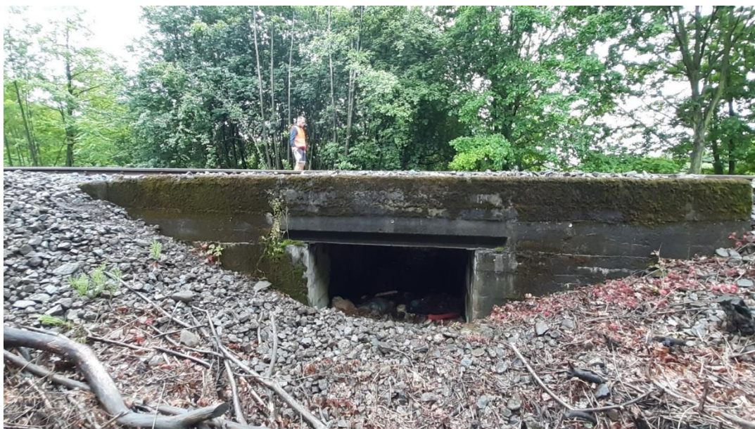
Foto č.16 - Propustek v km 114,185 - Pohled na výtok